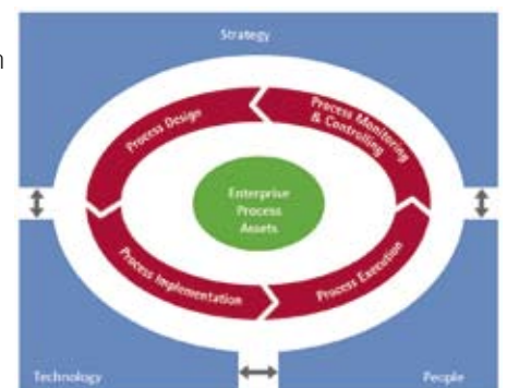
Übersicht Accenture Business Process Lifecycle Management

Accenture verfügt über umfassende Beratungserfahrung, kennt sich mit technischen Aspekten von Integrationsprojekten aus, versteht die Strategien, Ziele und Prozesse von Unternehmen und hilft ihnen damit Business Process Excellence zu erreichen. Wenn Prozessmodelle auf den gesamten Prozesslebenszyklus angewendet werden, entfalten sie ihre wertschöpfende Wirkung. Mit den Best-Practice-Prozessen von Accenture und mit Echtzeit-Systemen, beispielsweise für integriertes Monitoring, können Organisationen Vorteile aus ihren Prozessen ableiten und sich deutlicher gegenüber Wettbewerbern differenzieren.